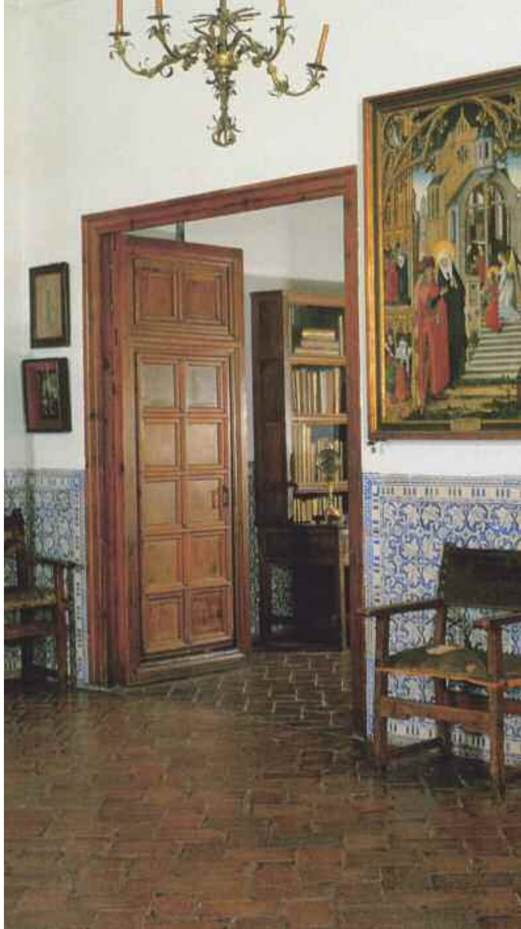
Fig. 2. Aposentos reales. Despacho privado y dormitorio de Felipe II desde su cámara.