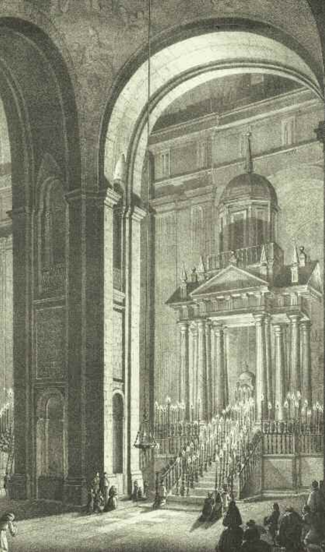
Fig. 1. Ceremonia religiosa del Jueves Santo en la Basílica, grabado del s. XIX por Rotondo. El Monumento hecho en madera es diseño de Juan de Herrera siguiendo la traza del Templo de los Evangelistas y del Tabernáculo. Hoy día se puede contemplar en la Basílica situado en el mismo sitio en el que aparece en el grabado. (Ver imágenes de este diseño, el más emblemático del Monasterio, en pp. 137, 170 y 201.)