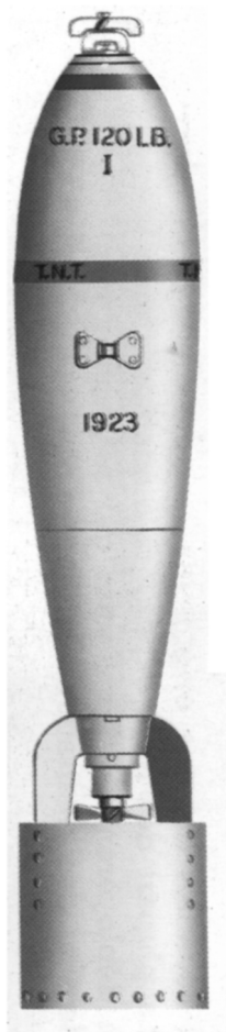
Bomba britanica standard de 54 kg.